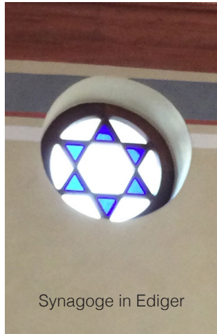
Synagoge in Ediger